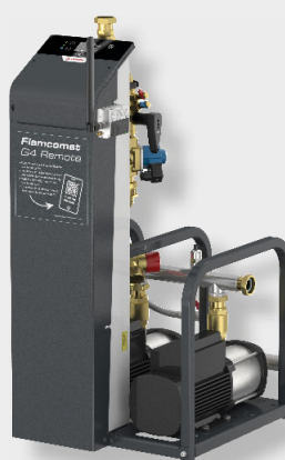
Flamcomat MP G4 D10