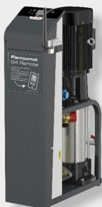
Flamcomat MP G4 M60