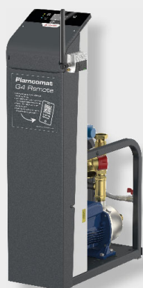
Flamcomat MP G4 M02