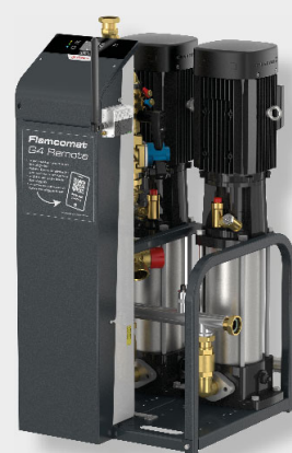
Flamcomat MP G4 D60